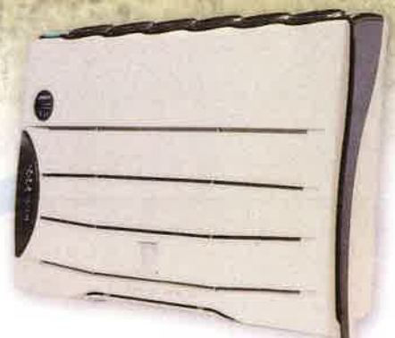
業務用空気清浄機 バイオミクロン BM-S801A

アセトアルデヒド 約0.0004 \mu\text{m} \mu\text{m} (マイクロメートル)=千分の1mm