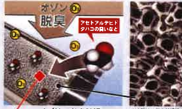
有機物をすばやく吸着・分解!

ハイブリッド光触媒は吸着した菌・ウイルスに対して大きな除菌効果を発揮します。光触媒により菌、ウイルスを不活性化させるだけでなく強力に酸化分解させることができます。